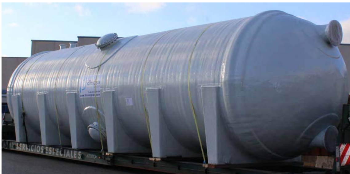
Dipòsit amb filtració de sorra horitzontal