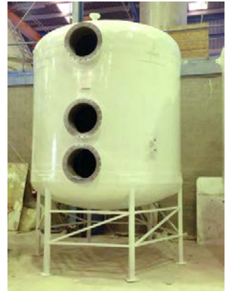
Dipòsit amb filtració de sorra vertical

Resistències del Polièster amb reforç 75% de fibra de vidre