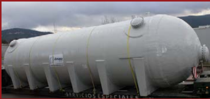
Dipòsit amb filtració de sorra horitzontal