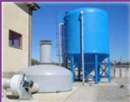
Equip de desodorització de 7000 m³/h