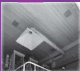
Campana aspiració de gasos