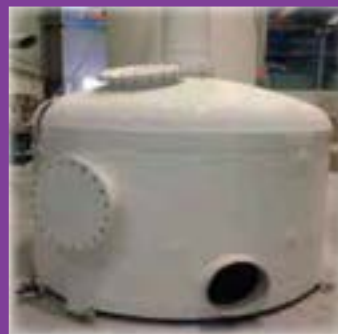
Filtres de carbó