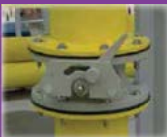
Vàlvula en PPH