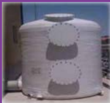
Fabricats en P.R.F.V. de simple o doble llit