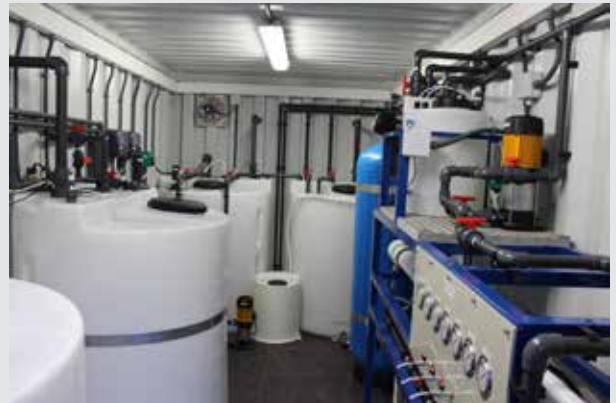
Interior del contenedor de Ósmosis Inversa