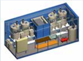
Vista interior en 3D del Contenedor del Tratamiento Físico - Químico

Eliminación de todos los contaminantes posibles del agua mediante una separación física (rejas de desbaste, filtros de malla, lechos filtrantes) y químicos (añadiendo coagulantes y floculantes para la precipitación y decantación de los sólidos en suspensión, y otros menores disueltos de forma coloidal).