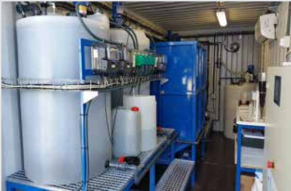
Interior del contenedor Físico - Químico

Proponemos un sistema integral en tres fases : Pretratamiento o desbaste primario, Tratamiento Físico-Químico, y un Tratamiento combinado de Membranas (Ultrafiltración, Nanofiltración y Ósmosis Inversa). El desarrollo de estas membranas son fruto de años de investigación y están fabricadas en exclusividad para los equipos de Dimasa Grupo .