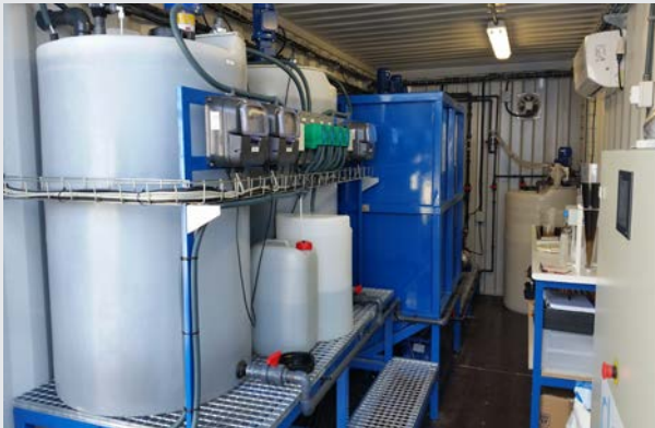
Interior del contenedor Físico - Químico

Proponemos un sistema integral en tres fases : Pretratamiento o desbaste primario, Tratamiento Físico-Químico, y un Tratamiento combinado de Membranas (Ultrafiltración, Nanofiltración y Ósmosis Inversa). El desarrollo de estas membranas son fruto de años de investigación y están fabricadas en exclusividad para los equipos de Dimasa Grupo .