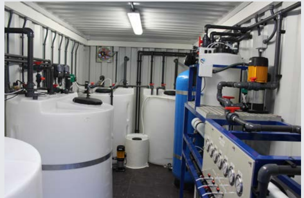
Interior del contenedor de Ósmosis Inversa