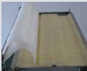
Vista zona de aspiración