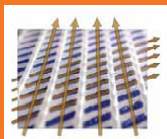
Módulos DFCT con canales de 45 grados