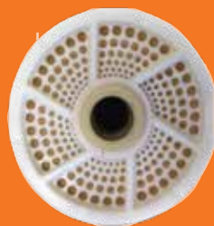
Membranas vista interior