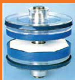
Interior del módulo DT