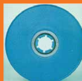
Disco hidráulico DT