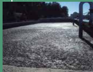
Lodos de depuradoras