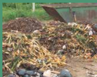
Residuos sólidos urbanos de vertederos